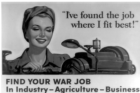
Američki plakat iz II sv. rata

„Našla sam posao gde se najbolje uklapam!“