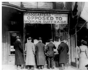
Glavni štab asocijacije protivne ženskom pravu

i seksualnosti. Da bi žene bile građanke, odnosno da bi imale mogućnosti učešća u javnoj sferi, mogućnosti odlučivanja o njoj i njenog definisanja, one su morale biti prepoznate kao pravna lica. To pravo, međutim, nije pripadalo udatim ženama, to jest najvećem broju žena širom sveta. Utoliko se priča o feminizmu u XIX stoleću načelno vezuje za pitanja nezavisnosti, prava na rad, prava na posedovanje svojine i prava na razvod. 8 Drugim rečima, sve dok je važila maksima po kojoj su „muž i žena jedno, a to jedno je muž“, 9 pitanje ženske emancipacije nije se moglo razlučiti od pitanja bračnog ugovora.