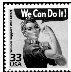
Američka poštanska markica

Ovo nas, konačno, ne sme začuditi, ukoliko imamo u vidu da se feminizam do sada svodio gotovo isključivo na praksu, ostavši rastrzan između međusobno nekoherentnih pojedinačnih formulacija koje su pristajale uz postojeće teorijske i/ili političke okvire. Feminizam nije imao sopstvenu teoriju . Njegova teorijska opravdanja od XIX veka gravitiraju između liberalne teorije i socijalističkih doktrina, ne iscrpljujući se ni u jednoj od njih, a razmimoilaženja koja se neprestano