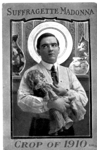
“Sifražetska Madona: izdanak 1910.”